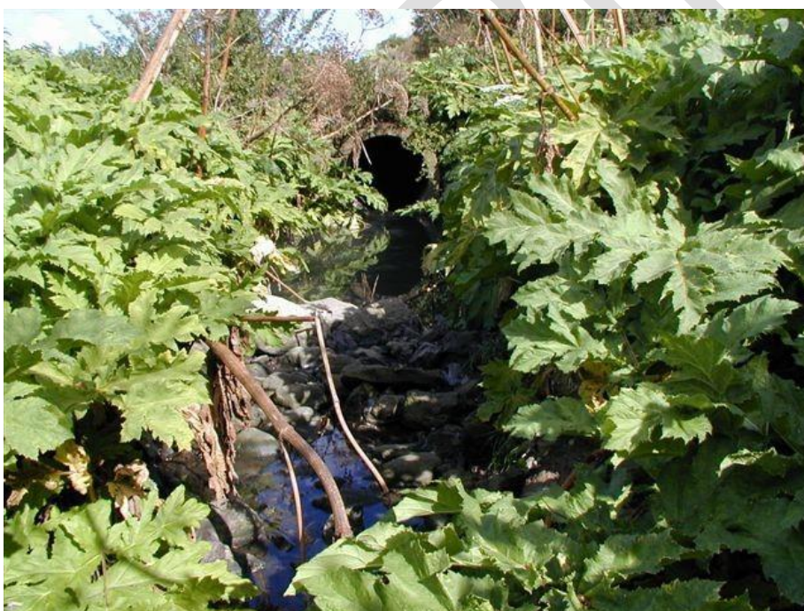
Kæmpe-bjørneklo ved Faxe Å Borreshoved.

To generelle ændringer i det danske kulturlandskab har formentlig også stor betydning for kæmpe-bjørneklos succes, nemlig den store mængde kvælstof som tilføres alle arealer gennem luften (eutrofiering), og det forhold at mange arealer er taget ud af drift og lagt brak. Planten trives særlig godt på fugtig, næringsrig bund, og spredningen er effektiv langs vandløb og søbredder samt langs veje og jernbaner. Der er derfor mange bestande af kæmpe-bjørneklo disse steder.