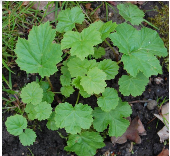
Nyudsprungne og små planter af kæmpe-bjørneklo

Planterne bliver op til 4 m høj, nogle gange endnu højere. Stænglen kan være op til 10 cm tyk og er stivhåret med røde pletter. Nyudsprungne planter har runde blade, men disse bliver efterhånden takkede og fuldt udviklede blade er saftiggrønne, meterlange og stærkt takkede. Roden er en kraftig pølerod.