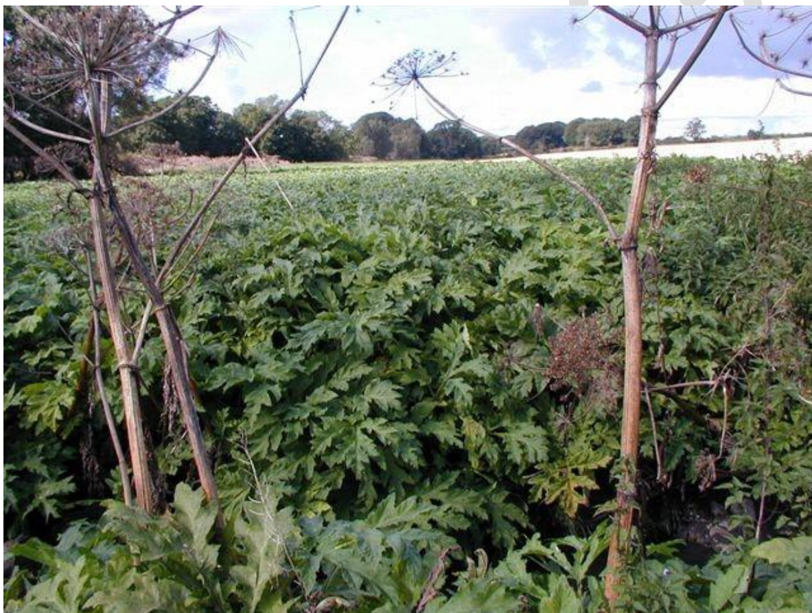
En eng langs Faxe Å ved Faxe Sygehus er overtaget af kæmpe-bjørneklo.

Områder med bestande af kæmpe-bjørneklo er ofte helt ufremkommelige for mennesker, og planten kan derfor være et stort problem i rekreative områder.