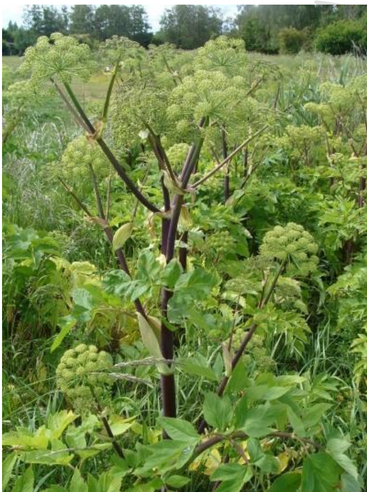
Strand-kvan har en rødlig glat stængel og kan blive op til 2,3 m høj. Blomsterskærmene er halvkugleformede og grønne i modsætning til kæmpe-bjørneklo. Strand-kvan vokser kun i kystnære områder og er relativt sjælden - pas derfor på ikke at forveksle den med kæmpe-bjørneklo i bekæmpelsen.

I Danmark findes der andre store skærmplanter, som kan forveksles med kæmpe-bjørneklo, f.eks. almindelig bjørneklo, strand-kvan og angelik. Andre planter har blade, der ligner kæmpe-bjørneklo, f.eks. kål-tidsel. Se billede-eksempler. Ingen af disse arter er invasive og de bør derfor ikke bekæmpes. De vigtigste kendetegn til at skelne de nævnte planter fra kæmpe-bjørneklo er, at de alle er mindre, og at ingen har rødpletet stængel med stive hår.