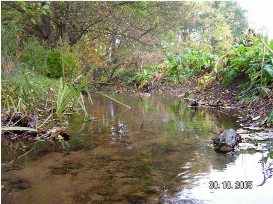
Faxe Å - naturlig brink vegetation skygget væk af kæmpe-bjørneklo på højre side.