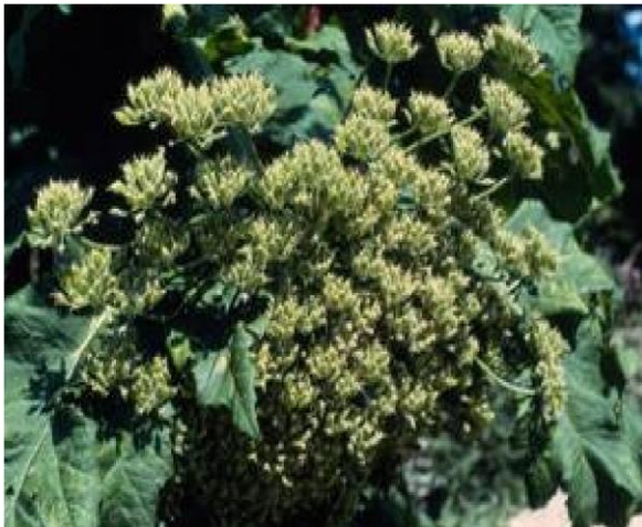
Det optimale tidspunkt at skærmkappe er, når planten har umodne grønne frø.

Det optimale tidspunkt for skærmkapning er når de blomstrende planter begynder at sætte grønne frø. På dette tidspunkt har roden opbrugt næsten al sin energi, så der er sjældent energi til panikblomster. Samtidig er frøene så uudviklede at de ikke kan færdigmodne, hvis de fjernes fra planten. Skærmkapningen skal ske inden frøene bliver modne (ca. 20. juli), og skærmen skal adskilles fuldstændigt fra stænglen, ellers vil frøene eftermodne på de afskårne skærme ved at suge energi fra stænglen.