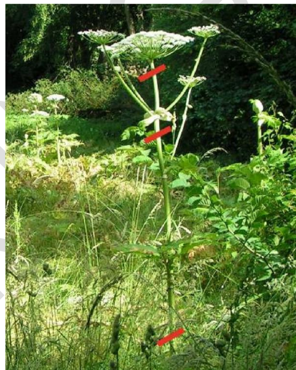
Illustration af, hvor bjørneklo skal slås når der skærmkappes. Er der grønne frø slås helt oppe under midterskærmen (øverst). Er der kun hvide blomster kan alle skærme slås med et slag (midt). Om den nedre del af stænglen slås (nederst) er valgfrit, men de nederste blade skal fjernes.

Ulempen ved skærmkapning er, at det kan være vanskeligt at bestemme det rette bekæmpelsestidspunkt. Derudover er det ubehageligt at arbejde blandt de store, blomstrende kæmpe-bjørneklo og det er næsten umuligt at undgå berøring med planterne. Derfor er det meget vigtigt med rigtig og beskyttende påklædning. Skærmkapning bør ikke foregå i sollys, så typisk skal der skærmkappes tidligt om morgenen eller sent om aftenen.