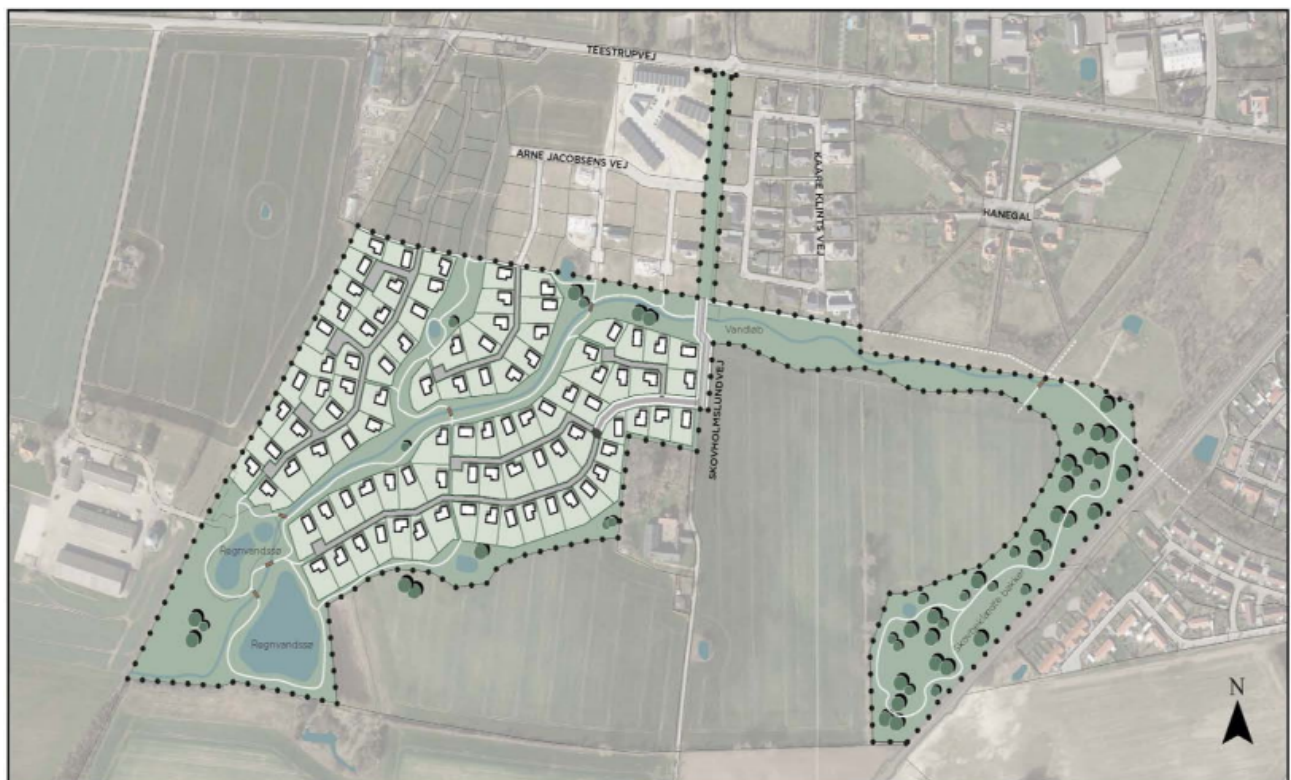
Lokalplan 500-91, Boliger ved Skovholmslund etape III

Skovholmslund etape III - Haslev (Høringsforslag)